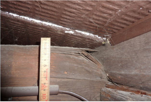
Unterstützung für Weinkellerbalken vor der Sanierung