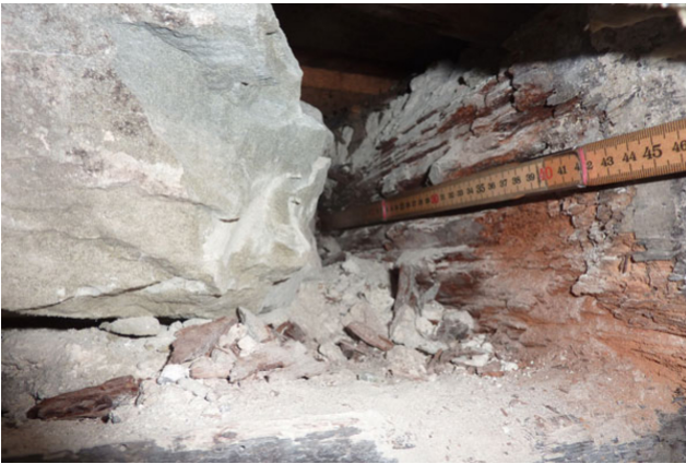
Deckenbalkenstütze in der Aussenwand im Weinkeller vor der Sanierung