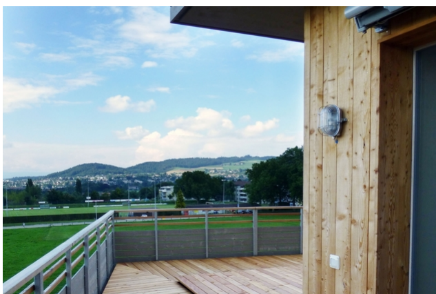
Haus C Terrasse mit Aussicht