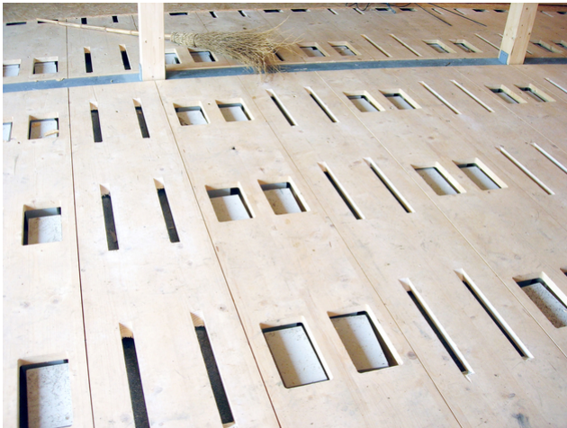
Füllen der Öffnungssignatur Stille