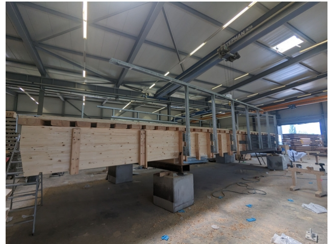
Vorfertigung der Brücke in den Ateliers von JPF-Ducret