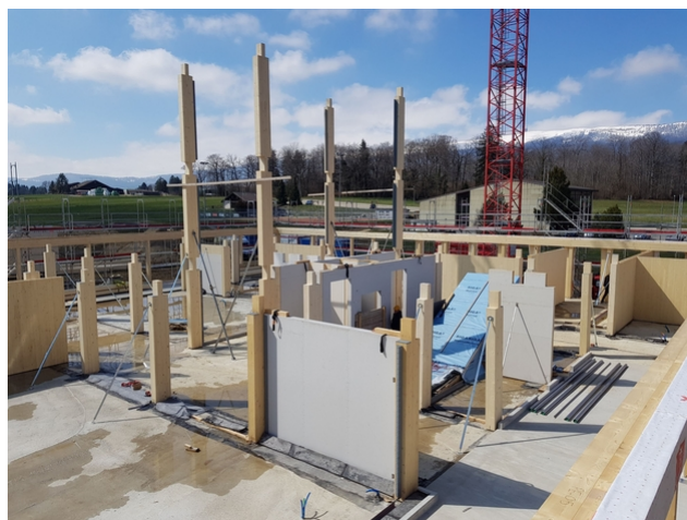
En cours de montage du rez-de-chaussée.