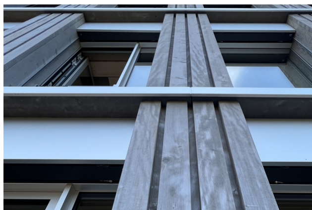
Façade en bois avec traitement de surface / Photos : luca da campo et École des Joncs à 2515 Prêles, Architecture: riforma architecture sa