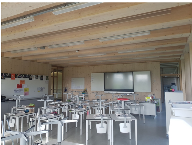
Intérieur d'une salle de classe.