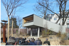
Plate-forme en bois près de l'enclos des éléphants de Bâle, Basel

A Kirchdorf, le kiosque à musique est le dernier élément du nouveau campus de formation. Il s'agit d'un solitaire isolé et visible de tous les côtés, avec la scène au sud et un arrêt de bus pour le bus scolaire au nord., Kirchdorf