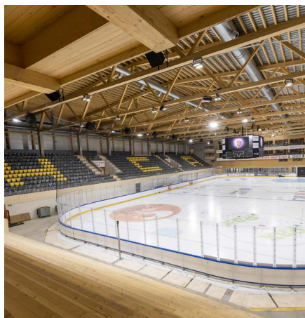
Patinoire d'Ajoie et du Clos-du Doubs

Nous construisons en bois par passion et observons les besoins naturels des hommes et de la nature. Nous respectons l'individualité de cette merveilleuse matière première tout comme nous respectons l'humain dans la vie de tous les jours.